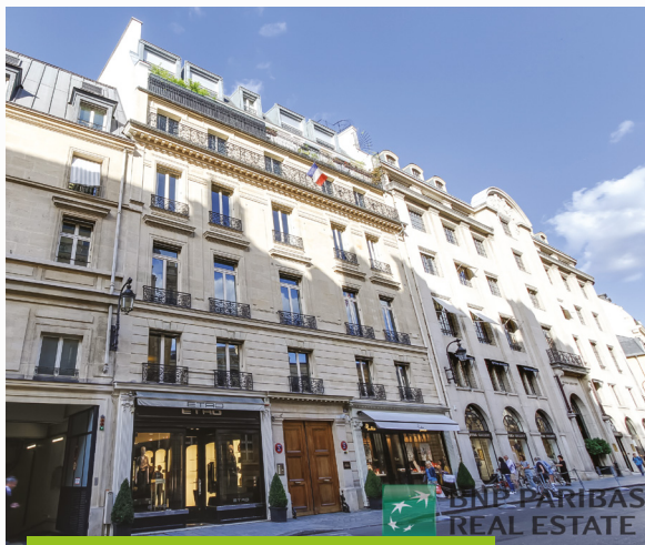
66, rue du Faubourg Saint-Honoré - Paris (75008)

Par ailleurs, afin de préserver le bon niveau de report à nouveau tout en optimisant la distribution, celle du 3 ème trimestre est identique au trimestre précédent et s'établit à 3,50 € par part dont 2,00 € par part provenant du stock de plus-values réalisées au fur et à mesure des arbitrages passés.